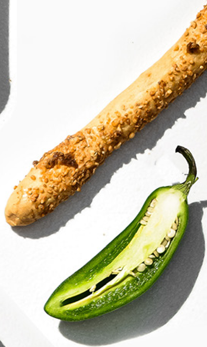
JALAPEÑO POPPER DIP Q58