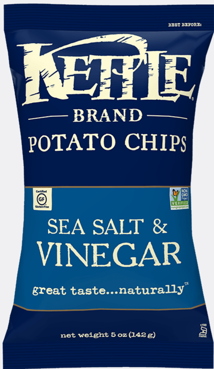
SEA SALT & VINEGAR