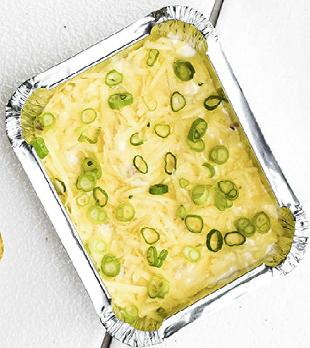
STUFFED POTATO DIP Q58